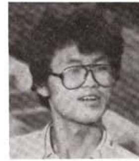
배우 : 이영민