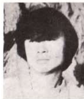
연출 : 이용섭

不滿과 非理, 不正, 暴力……, 세상을 종식시킬 惡의 뿌리들 있는 자들의 부식물인 찌꺼기들이 없는 이들의 思考의 옷을 더럽게 물들이고 있다. 판도라의 상자 속에 希望의 꿈틀거림이 우리의 靈魂을 건질 것이다.