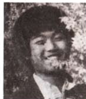
무대 미술 : 이종규