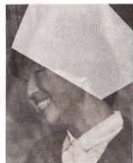
나스짜 : 황금실