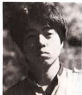
조명 : 허성무